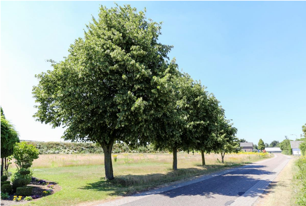
Foto: kavels Boomsweg Melderslo