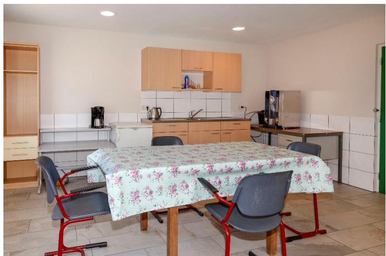
De loods beschikt over goed verzorgde sanitaire voorzieningen en een royale kantine met keukenblok.